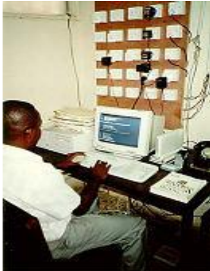
Monen samanaikaisen käyttäjän PC

Ife-projekti on julkaissut useita tieteellisiä ja ammattijulkaisuja. Projektissa rakennettu järjestelmä oli ensimmäinen sairaalatietojärjestelmä, joka on rakennettu Saharan eteläpuoleisessa Afrikassa lukuunottamatta Etelä-Afrikkaa.