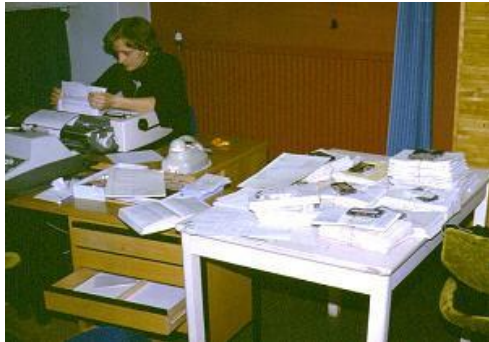
Sairauskertomusten tallennusta ...

Seuraavat kuvat ovat Varkauden terveyskeskuksesta ajalta ennen Finstarin käyttöönottoa.