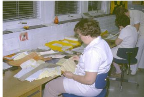
... lajittelua ...