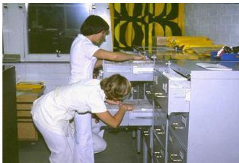
... etsintää ...